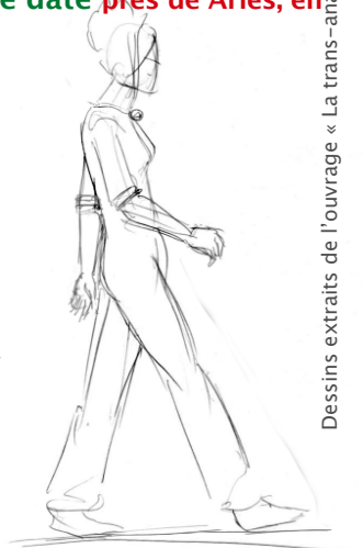
Dessins extraits de l'ouvrage « La trans-analyse »

o 3, 4 & 5 juillet 2020 près de Arles, en résidentiel