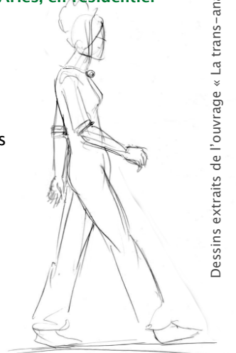
Dessins extraits de l'ouvrage « La trans-analyse »

o 2, 3 & 4 juillet 2021 près de Arles, en résidentiel