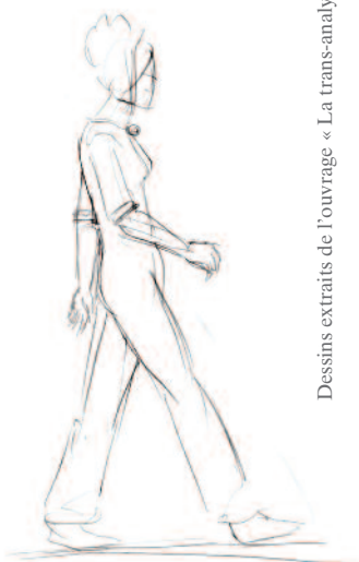
Dessins extraits de l'ouvrage « La trans-analyse »

L'espace du jeu investi, il est alors possible de « jouer » les dynamiques de vie (de mouvement) qui nous animent et de découvrir à la fois nos manques et nos excès; ces dynamiques sont révélatrices de l'influence de nos polarités psychiques sur nos comportements, mais également porteuses de vertus archétypales à épanouir. Week-end ouvert à toutes et tous.