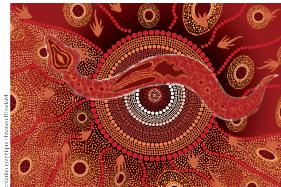
création graphique : Imanou Risselard

tél. Marie-Aliette Delaneau : 06 63 20 00 29 - email : contact@trans-analyse.com